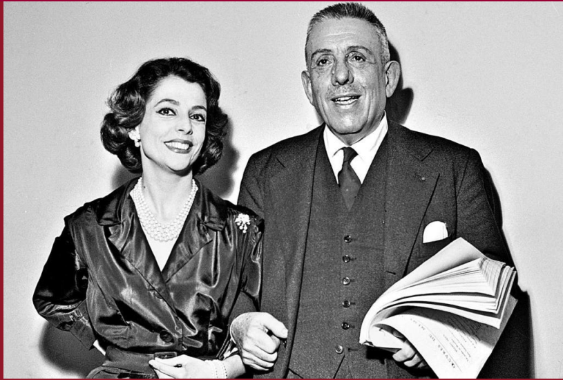
Poulenc en Denise Duval

In 1958 bewerkte Francis Poulenc het stuk tot een opera in één akte. Op 2 juni van dat jaar was de piano versie voltooid. De orkestratie volgde twee maanden later. Op 6 februari 1959 ging het werk in première in de Opéra Comique onder George Prêtre met Denise Duval als de vrouw. Duval had eerder met veel succes de rol van Blanche gezongen in de Parijse première van Dialogues des Carmélites en was zeer 'close' met Poulenc die zich naar verluidt naast Cocteau's tekst ook heeft laten inspireren door haar stormachtige liefdesleven.